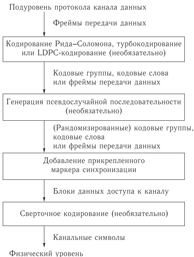
Рис. 2. Внутренняя организация подуровня синхронизации и кодирования каналов стороны источника информации

С комплексированием также связаны методы помехоустойчивого кодирования и условия их осуществления (рис. 2) [2].